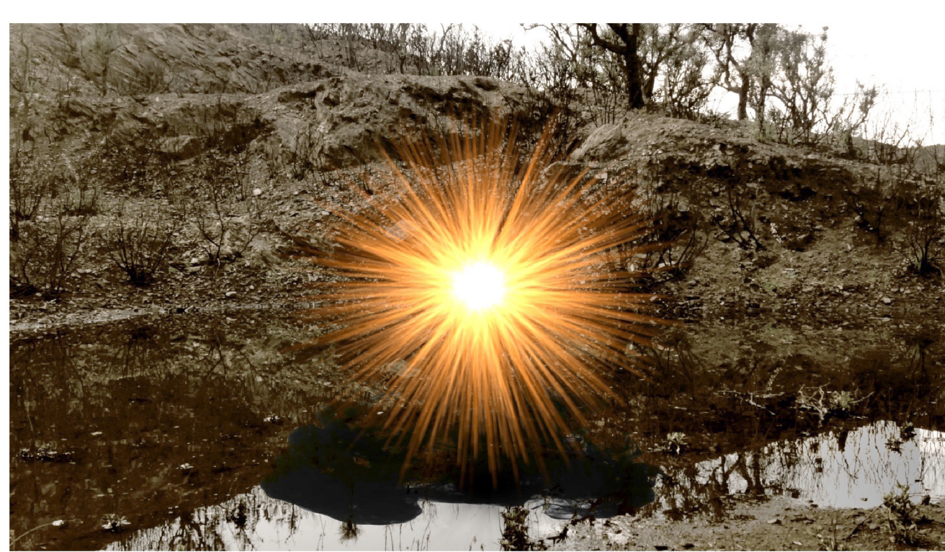
Samuel Bester - XIII fragments, vidéo 11'23, 2022

En explorant l'ambiguïté par l'intermédiaire de la nuance, la déformation ou l'accident, je cherche à augmenter la dynamique entre la perception, l'interprétation et l'émotion. Utilisant un langage poétique souvent métaphorique, j'amplifie la curiosité en brouillant les significations apparentes, produisant ainsi des images mentales inattendues. Le temps et la mémoire ont toujours une fonction clé dans mon travail audiovisuel.