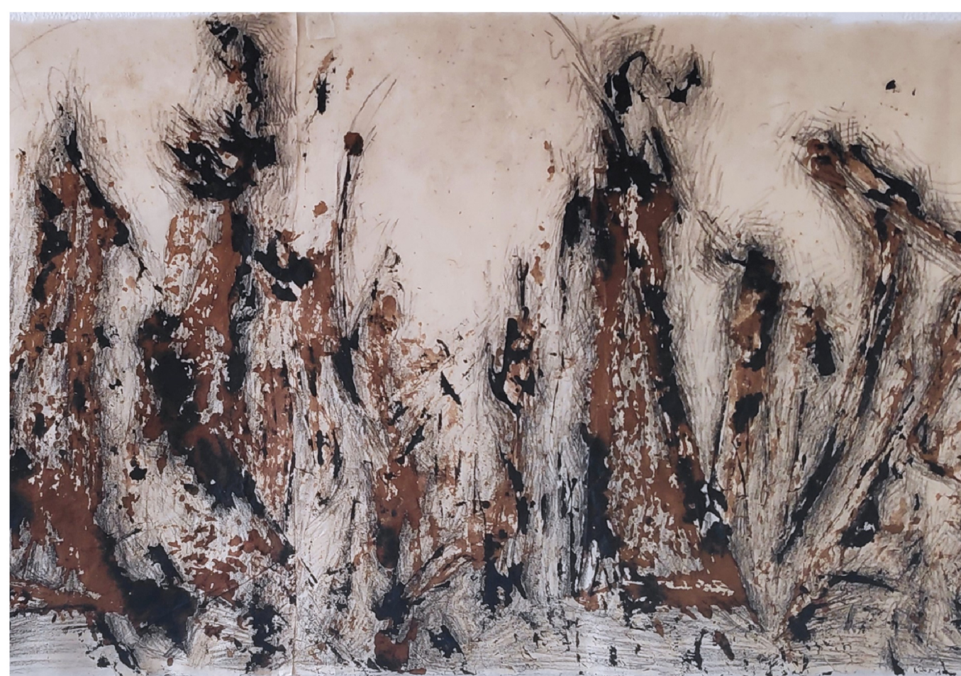
© Satabdi Hati - Forest series, 50x140cm