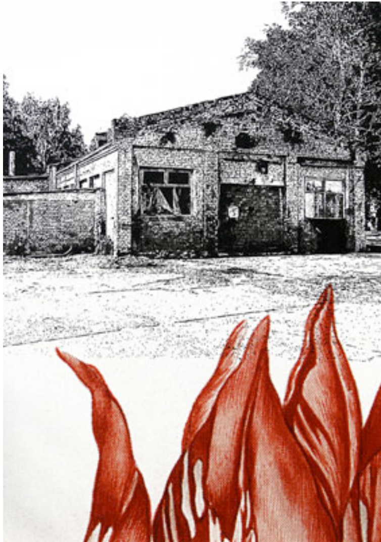
Joffrey Ferry Between or beyond the black forest 4 - encre de chine, impression UV sur Toile (148x100 cm)

Bureau et galerie : Ateliers d' Artistes de la Ville 11,19 Bd Boisson 13004 Marseille Tél 04.84.26.94.28 Fax 04 91 85 13 47 email : chateaudeservieres@gmail.com