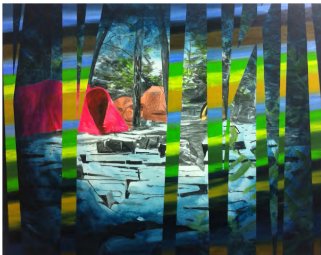
Nicolas Pincemin - TENTE I - 2013 - huile et acrylique sur toile - 162x130cm crédit photo de l'artiste.

Je laboure mon sillon dans le même paysage. Richter, Doig et les autres ne sont pas bien loin derrière moi mais j'essaye de les semer ! Du coup, je suis toujours à l'affût. Position assez instable qui consiste à attendre, et regarder. Je ne suis ni un chasseur ni un sanglier. Etre à l'affût, c'est être l'affût de quelque chose ou de soi-même. Attente positive et soucieuse, avec la certitude bienveillante qu'il va se passer quelque chose. Rien d'extraordinaire à cela, c'est une attitude, ma posture face au monde. Je laboure mon sillon et je retourne dans la forêt. Finalement, peindre et regarder, c'est un peu la même chose. L'image se forme dans le cerveau ou sur la toile, c'est une question de support.