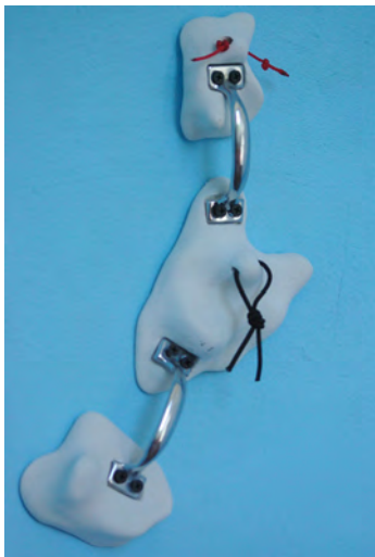
Accroche toi, 2013 céramique, métal, corde, dimension variable