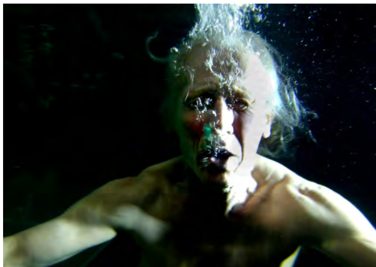
Pauliina Salminen Contre-courant, 2013 Installation vidéo