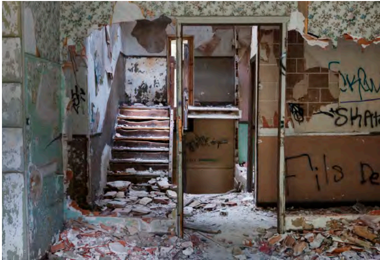
"je l'aimais" - tirage photographique sur papier mat - 295x193cm 2013

"La peinture ici est un lieu de passage et de projection. On est dans une forme de Visitation. On retrouve dans cette idée d'installation un parallèle à l'esprit de la peinture pour Nicolas Desplats, à la fois lieu de sacralisation et édification païenne. On entre dans l'exposition comme dans sa chapelle.