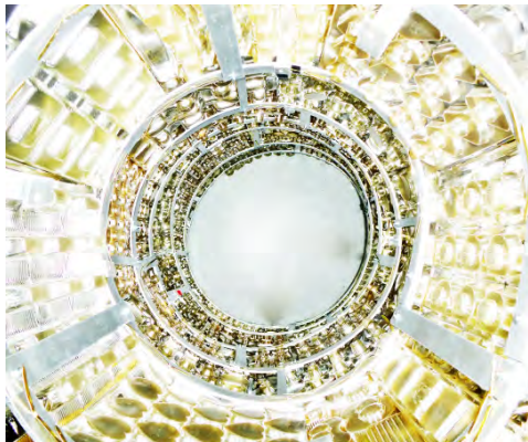
Fin de partie : Ambassadrice déchue, 2013 Plastique & métal 175 x Ø 75 cm © Gilles Oleksiuk