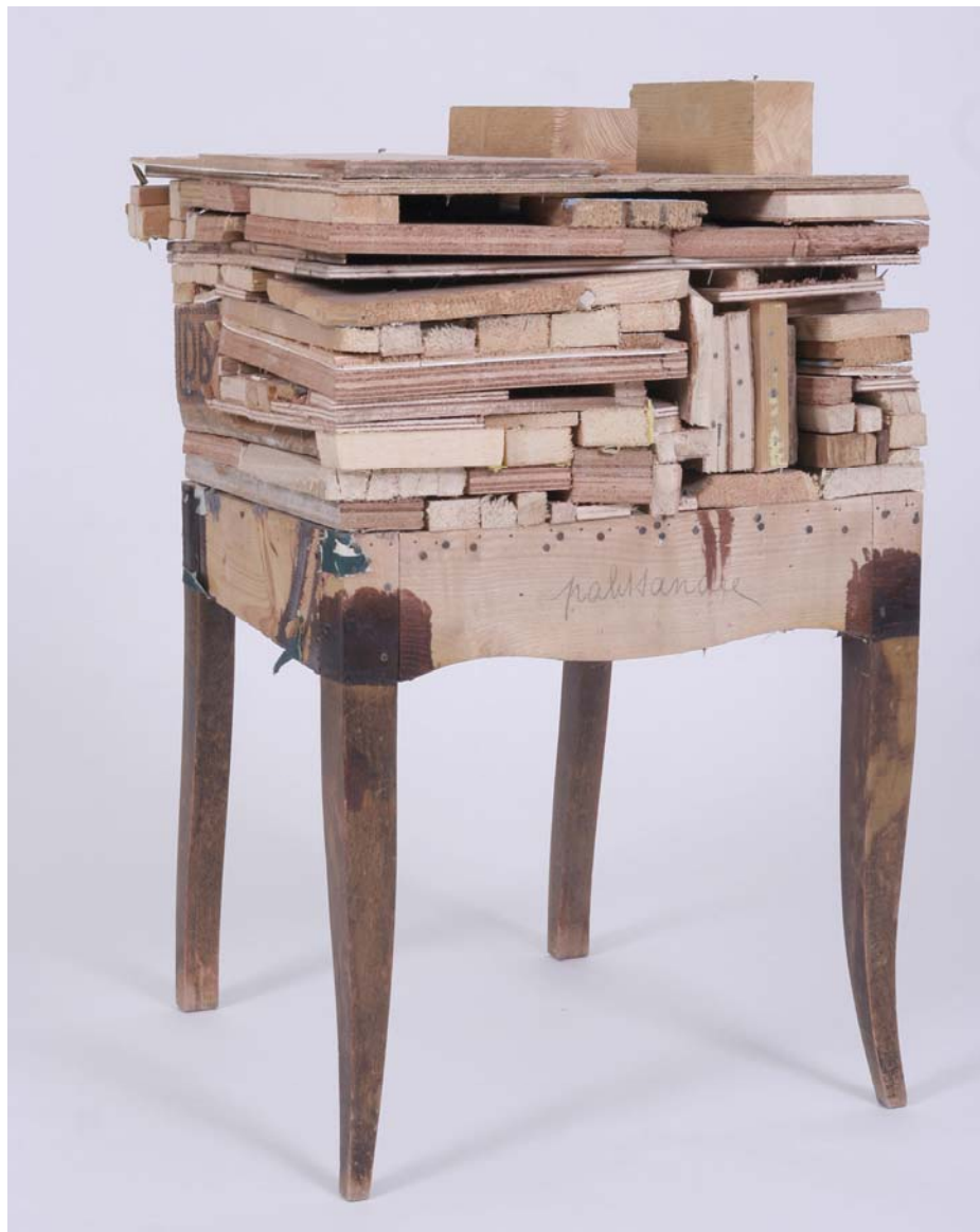
Adrien Porcu Sculpture Palissandre , 2006, meuble, bois, 60 x 85 x 100 cm

Bureau et galerie : Ateliers d' Artistes de la Ville 11,19 Bd Boisson 13004 Marseille Tél : 4.91.85.42.78 Fax 04 91 85 13 47 email : chateaudeservieres@gmail.com