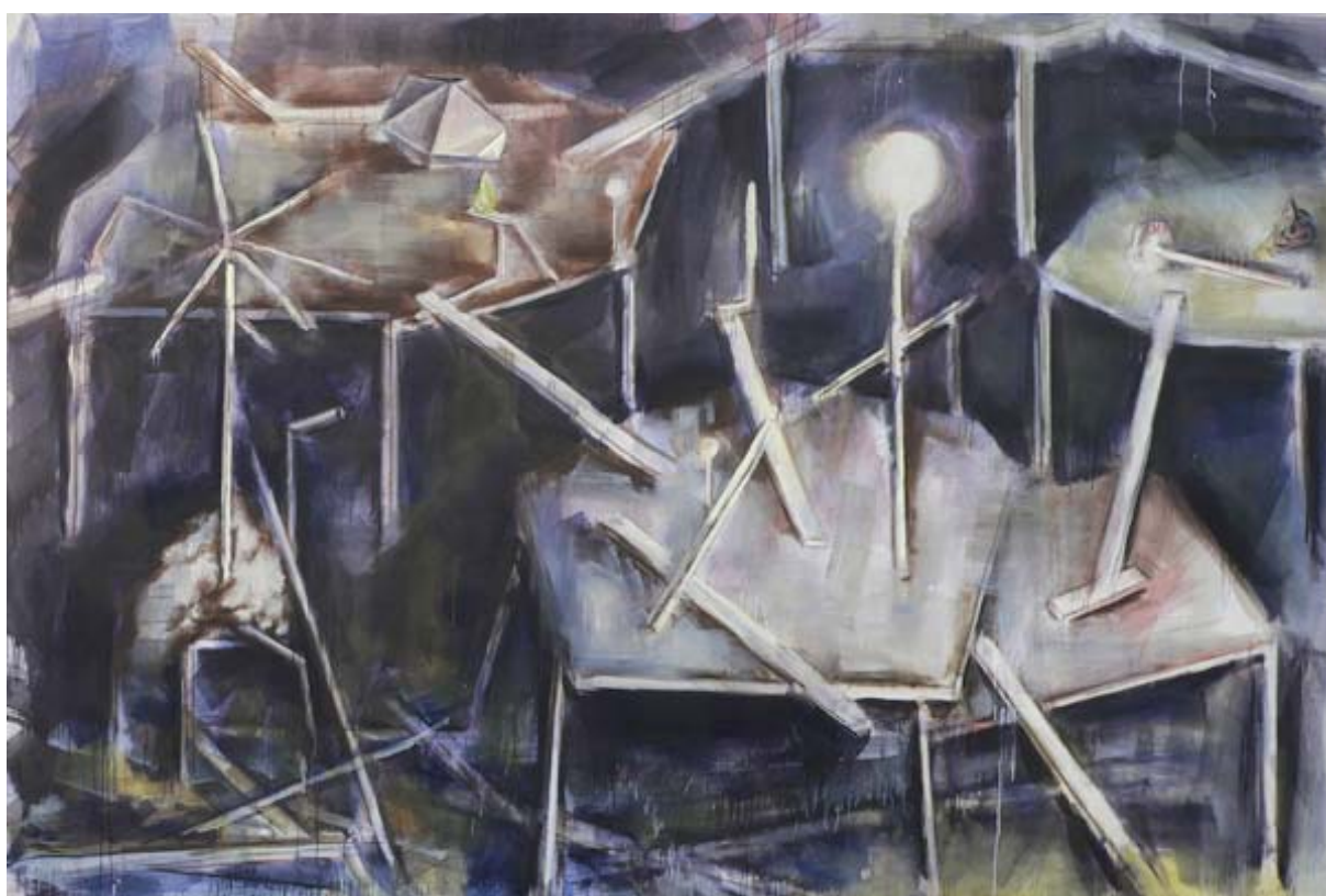
Matthieu Montchamp Paramonde bleu , 2010, huile sur toile, 300 x 200 cm

Bureau et galerie : Ateliers d' Artistes de la Ville 11,19 Bd Boisson 13004 Marseille Tél : 4.91.85.42.78 Fax 04 91 85 13 47 email : chateaudeservieres@gmail.com