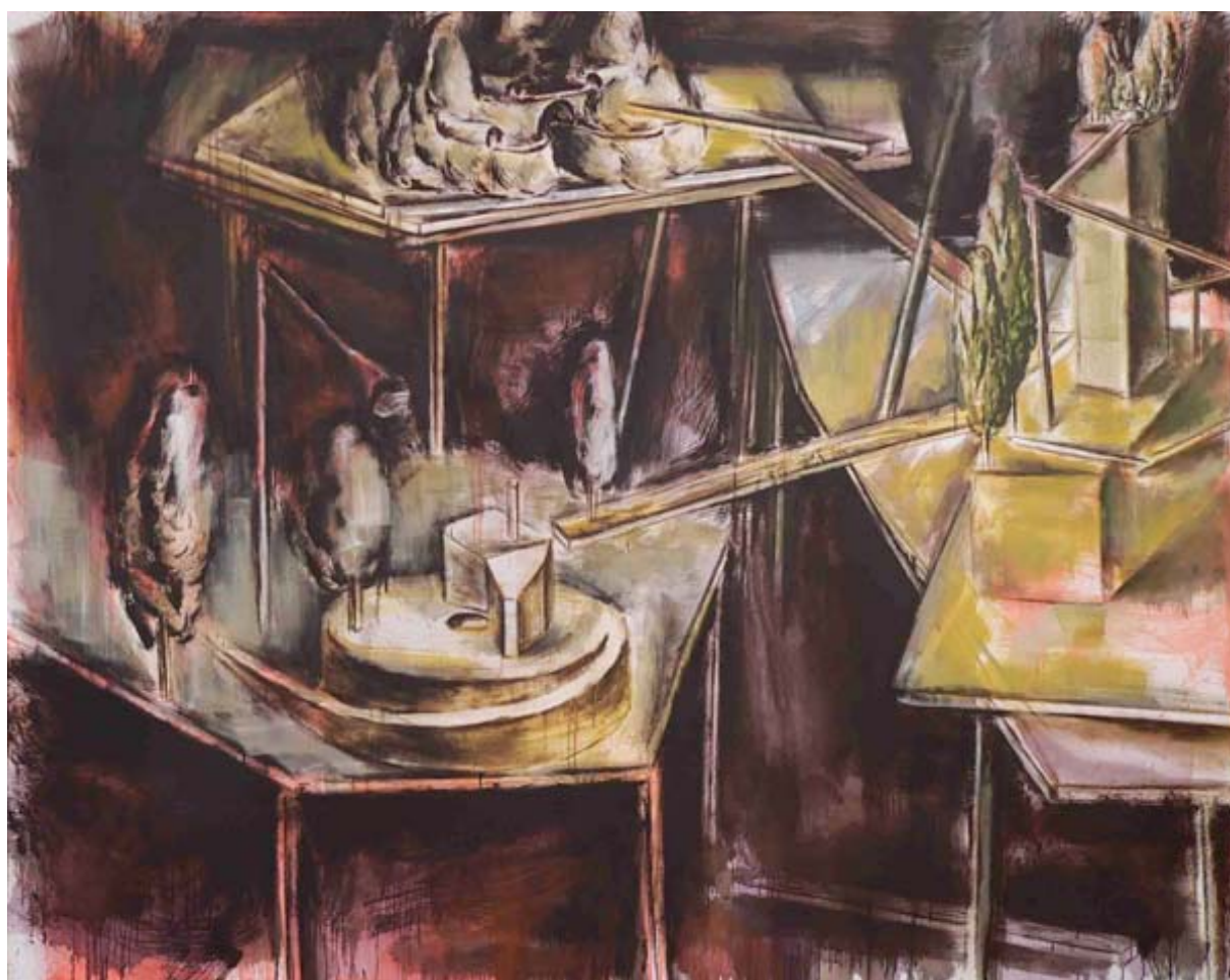
Matthieu Montchamp sans titre , 2010, huile sur toile, 250 x 200 cm

Bureau et galerie : Ateliers d' Artistes de la Ville 11,19 Bd Boisson 13004 Marseille Tél : 4.91.85.42.78 Fax 04 91 85 13 47 email : chateaudeservieres@gmail.com