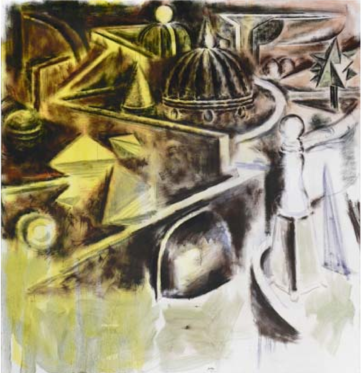
Matthieu Montchamp L'horloge , 2010, huile sur toile, 195 x 188 cm

Bureau et galerie : Ateliers d' Artistes de la Ville 11,19 Bd Boisson 13004 Marseille Tél : 4.91.85.42.78 Fax 04 91 85 13 47 email : chateaudeservieres@gmail.com